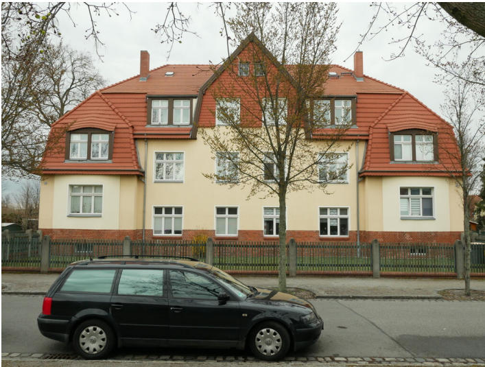
Wohngebäude der Kolonie Marga