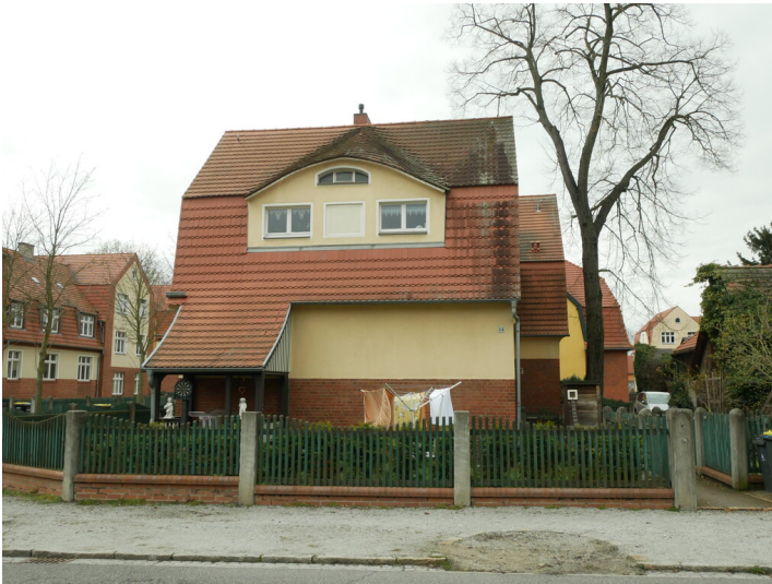
Wohngebäude der Kolonie Marga