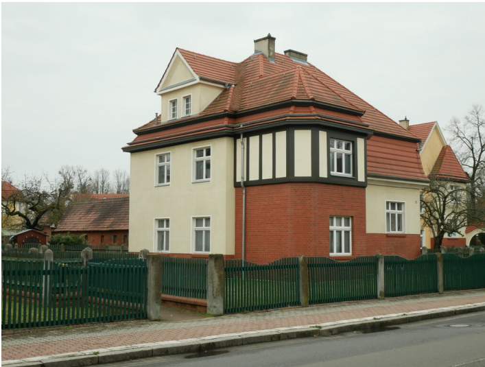
Wohngebäude der Kolonie Marga