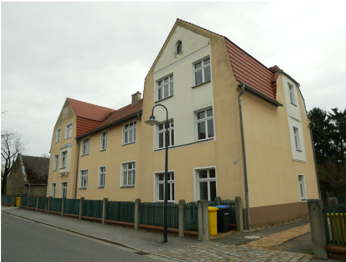
Wohngebäude der Kolonie Marga