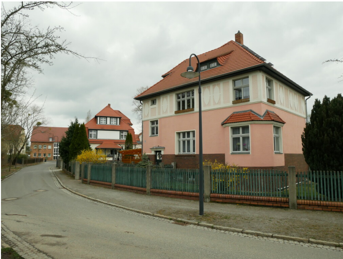
Wohngebäude der Kolonie Marga