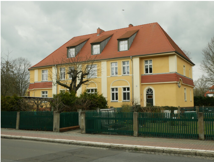
Wohngebäude der Kolonie Marga