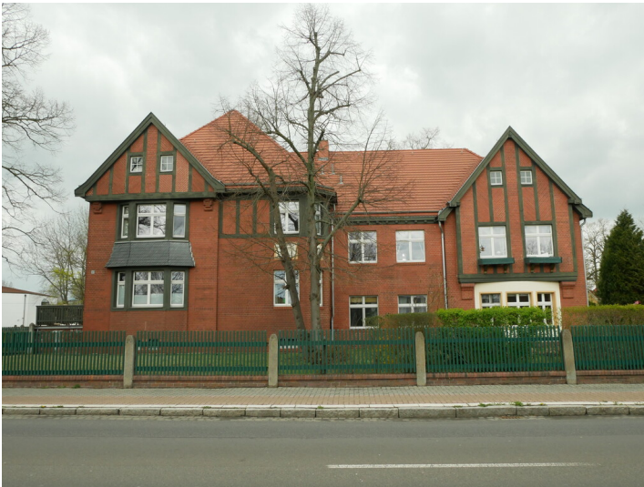
Wohngebäude der Kolonie Marga