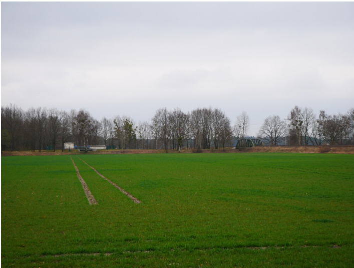
Bahnlinie Lübbenau-Kamenz