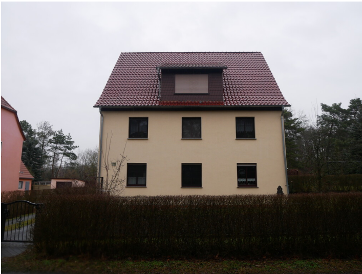
Wohnanlage der Eintracht Braunkohlewerke und Brikettfabriken AG