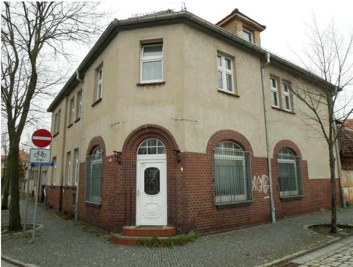
ehem. Fleischerei der Kolonie Marga