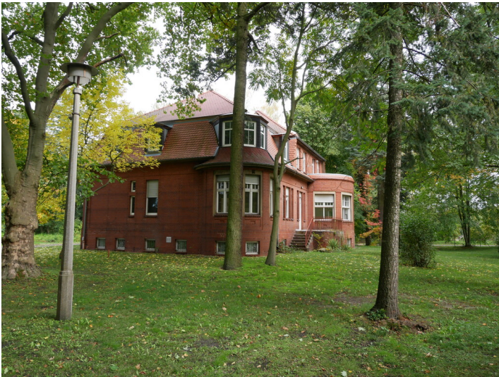
ehem. Ärztevilla des ehemaligen Bergmannkrankenhaus Klettwitz