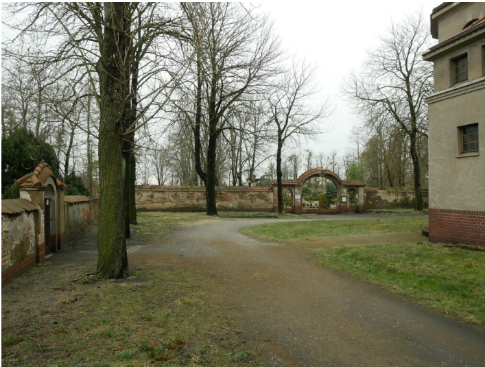
Friedhof der Kolonie Marga