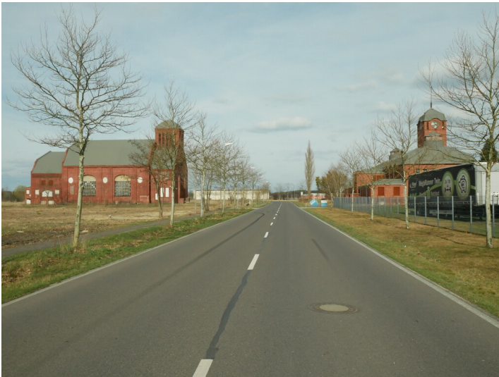
Maschinenhaus und Kraftzentrale der Brikettfabrik Marga