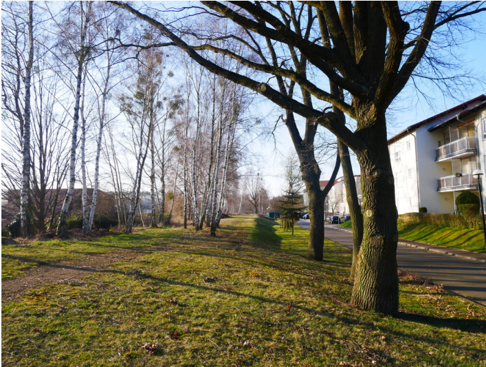
ehem. Bahndamm in Brieske