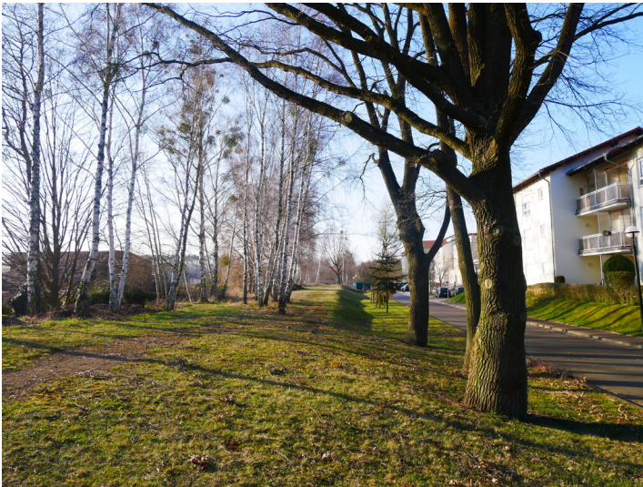
ehem. Bahndamm in Brieske