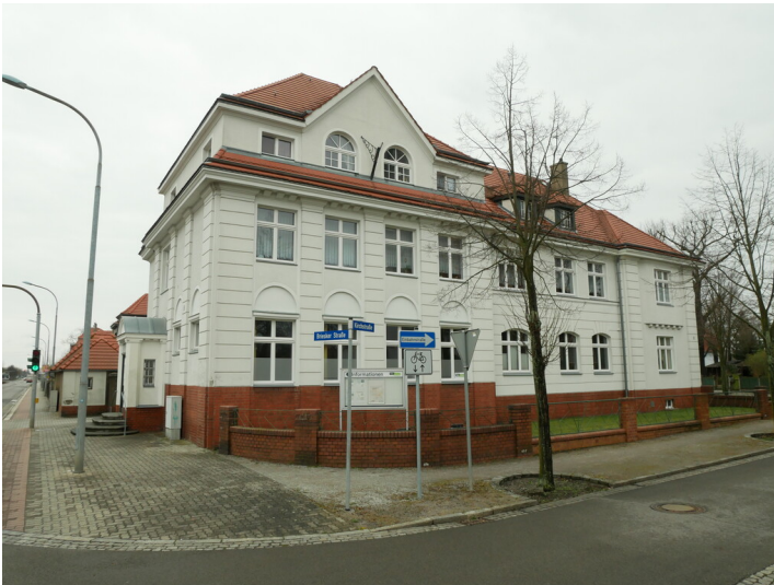
Post der Kolonie Marga