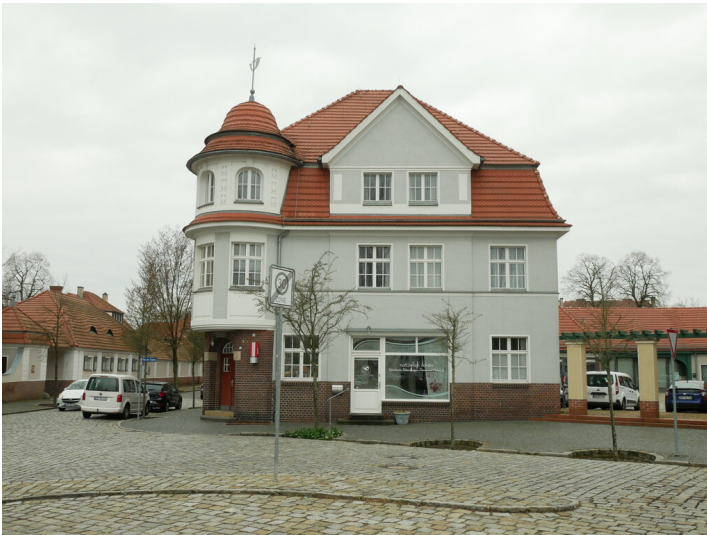
ehem. Friseurgeschäft der Kolonie Marga