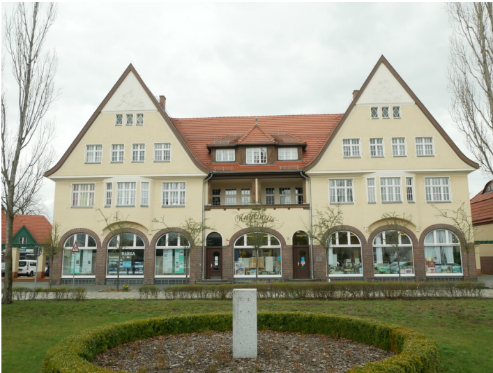
ehem. Kaufhaus der Kolonie Marga