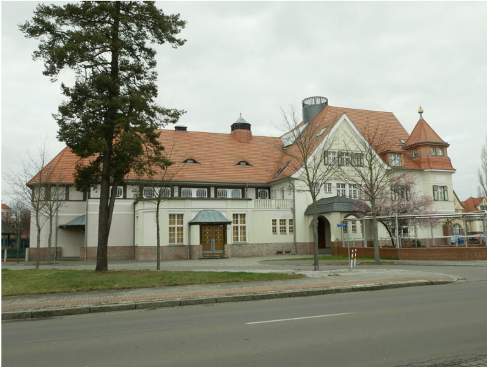
ehem. Gasthof der Kolonie Marga