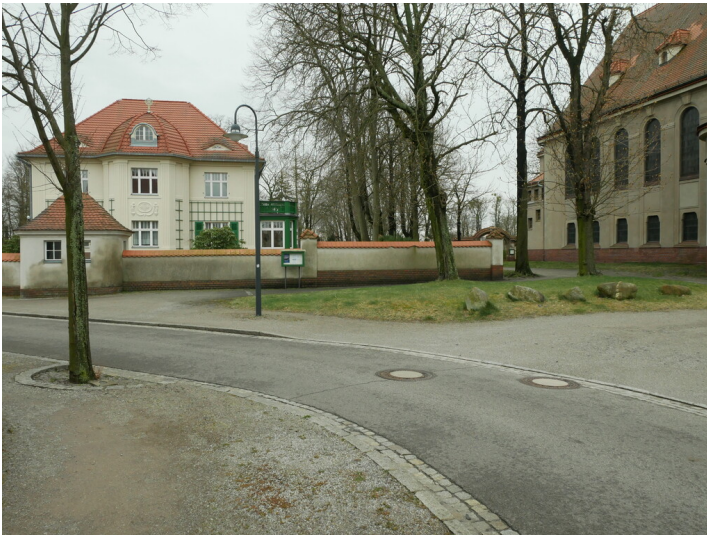
Pfarrhaus Kolonie Marga