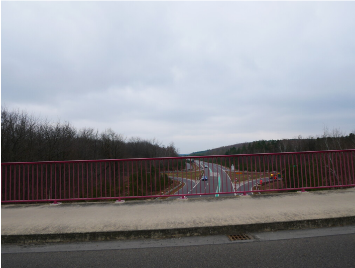
B 169