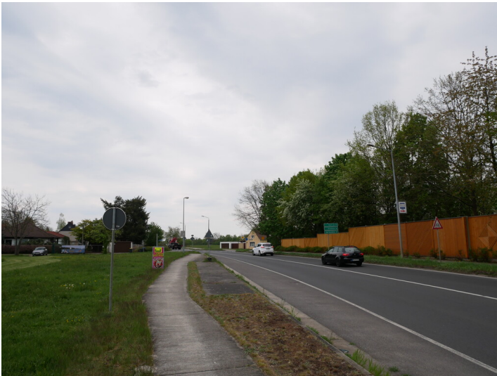
B 96