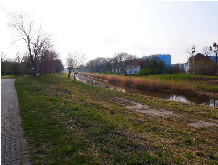
Schwarze Elster