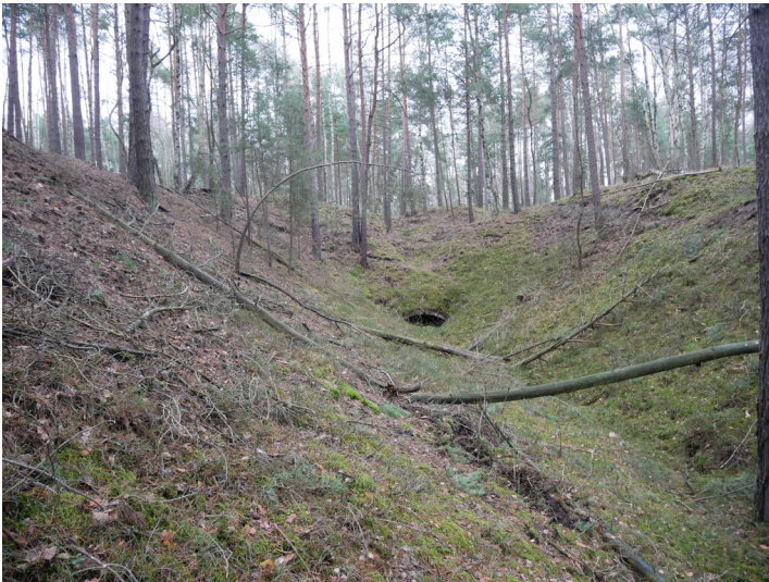
Stollenmundloch Grube Bismarck oder Liebenwerda