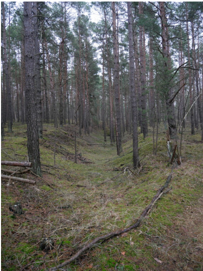
Gruben Bismarck, Liebenwerda, Michael und Maasdorf