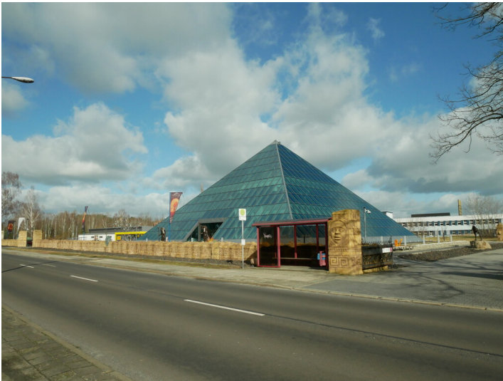
Show- und Verkaufsraum der Cristalica Kingdom GmbH