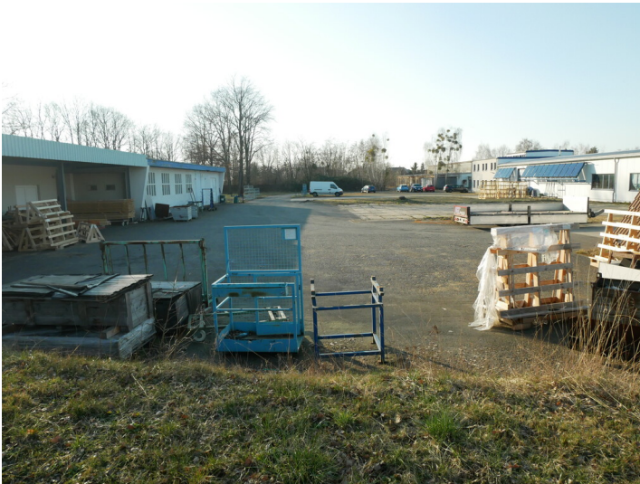
Tagesanlagen Koschen