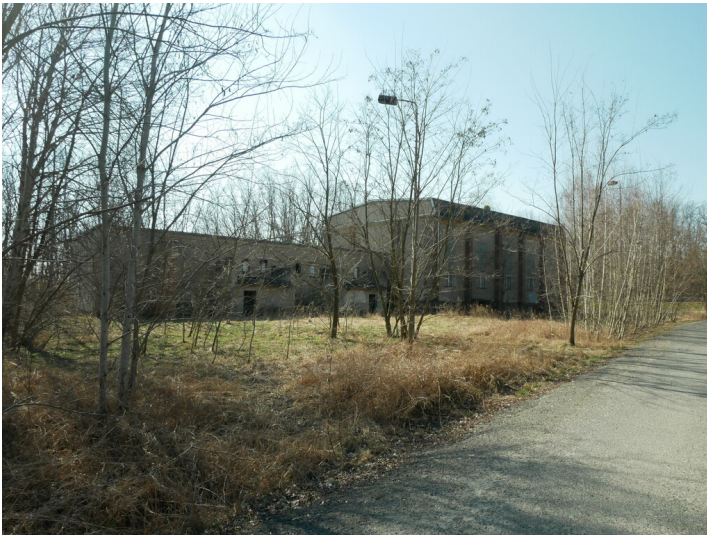
30/15/0,4-kV-Station I Sedlitz