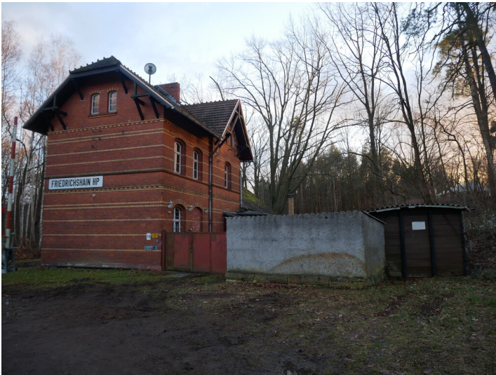
Bahnhof Friedrichshain