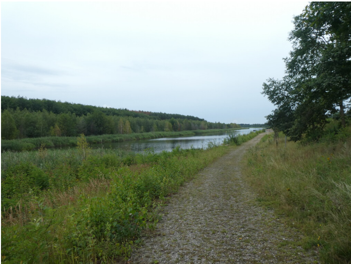
Koschener Kanal