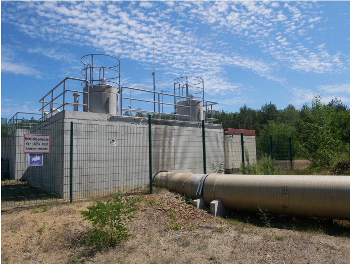
Pumpstation Rainitza