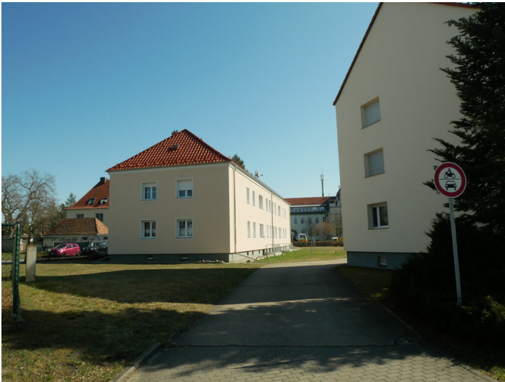
Siedlung Schillerstraße AWG Frohe Zukunft