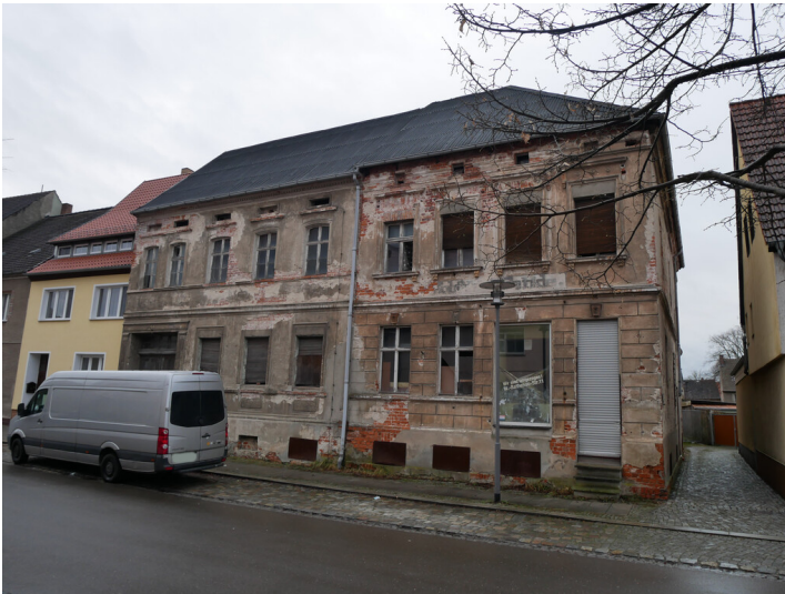
Stadtbrauerei Kühne