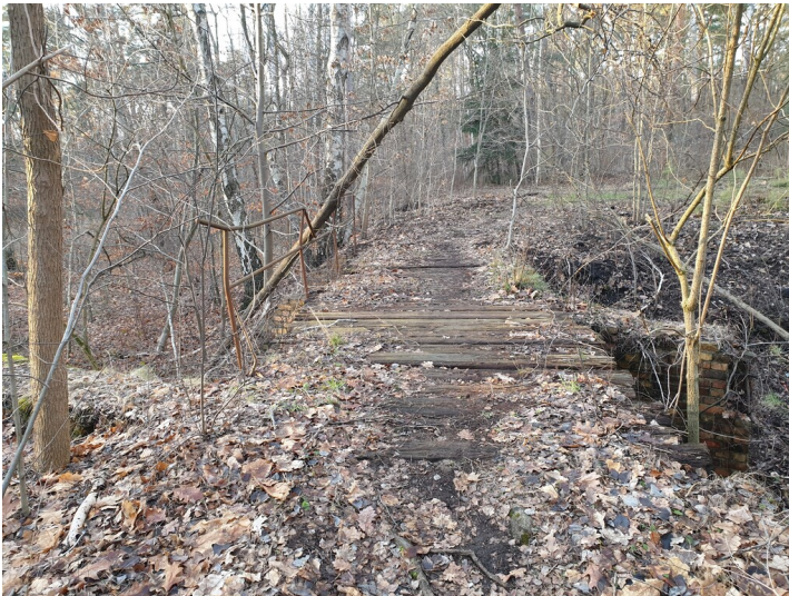
Brücke und weitere Fragmente aufstrebenden Mauerwerkes, vermutlich Wirtschaftsbahn Grube Julius