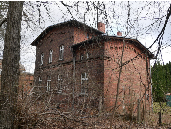
Wohnhaus unmittelbar in Nähe des Bahnhofs Döbern