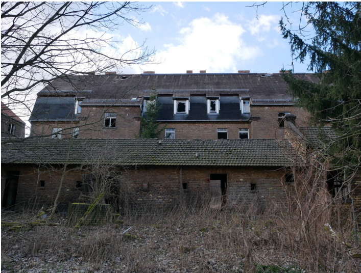
Mehrfamilienwohnhaus in der Werksiedlung vermutlich der Lausitzer Glashütte AG

Schlagwörter: Wohnhaus Fachsicht(en): Denkmalpflege Gemeinde(n): Döbern Kreis(e): Spree-Neiße Bundesland: Brandenburg