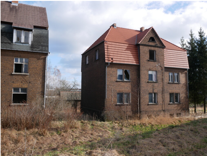
Werksiedlung vermutlich der Lausitzer Glashütte AG