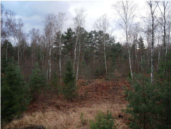
Außenhalde der Grube Notzeit BKW Vorwärts

Schlagwörter: Abraumhalde Fachsicht(en): Denkmalpflege Gemeinde(n): Tschernitz Kreis(e): Spree-Neiße Bundesland: Brandenburg