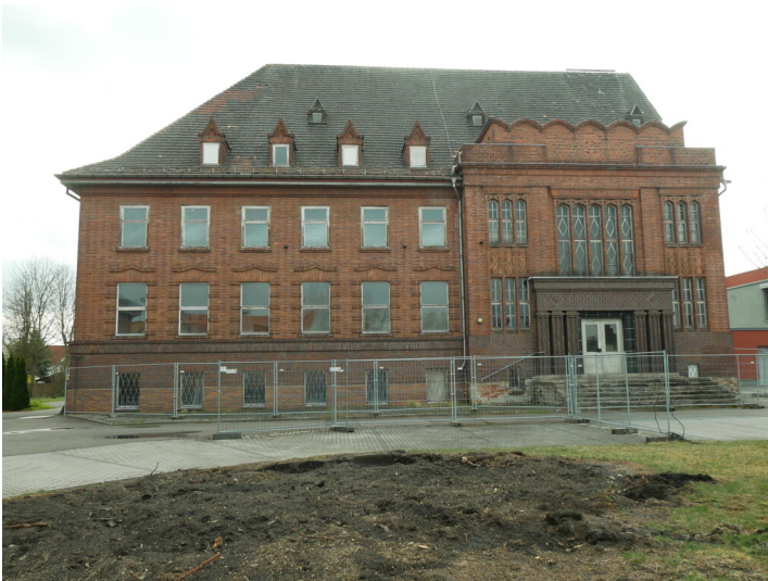
ehem. Verwaltungsgebäude der Anhaltinischen Kohlewerke