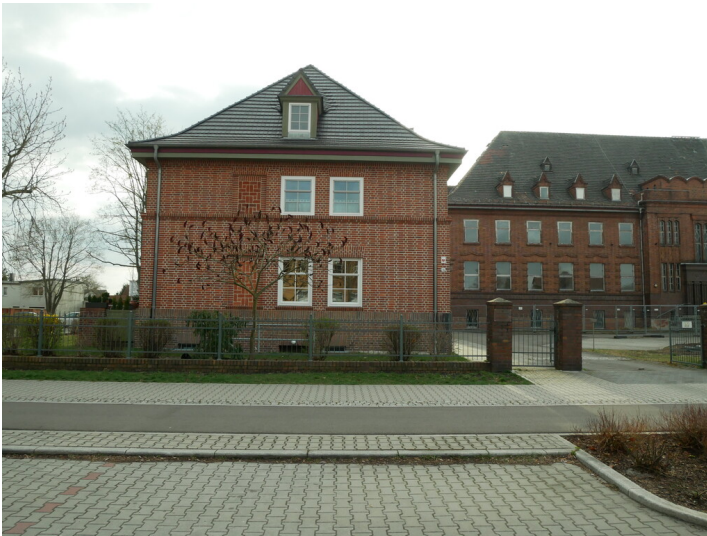
Beamten Doppelwohnhaus der ehemaligen Anhaltinischen Kohlenwerke neben dem Verwaltungsgebäude