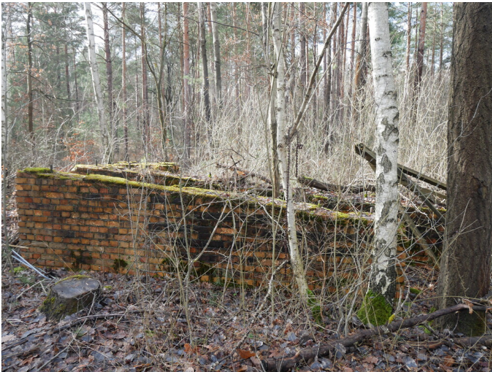
Fragmente aufstrebenden Mauerwerks aus Ziegeln einer Kettenbahn