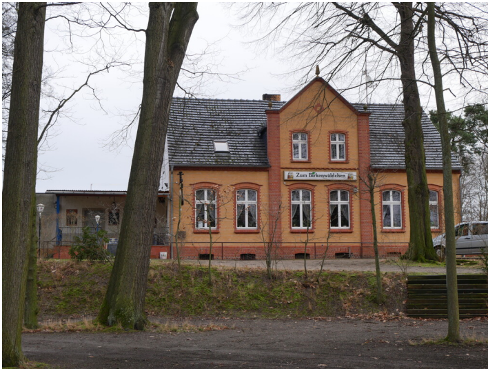
Zechenhaus der Grube Agnes