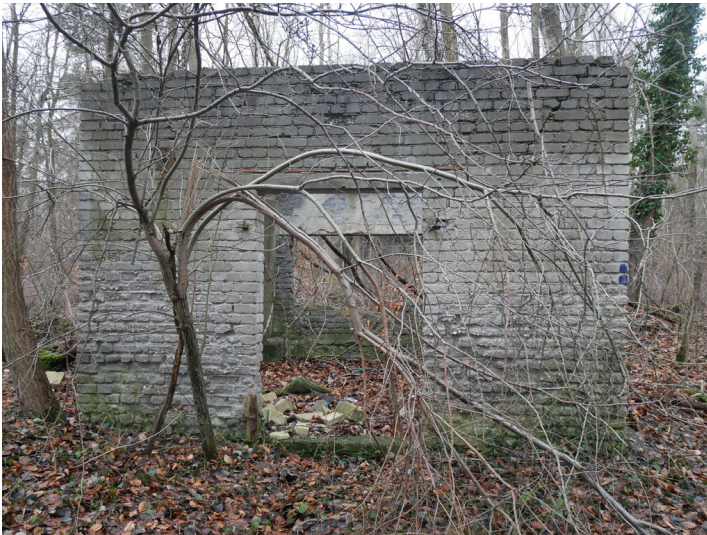
Kettenbahn Pauline-Pauline II