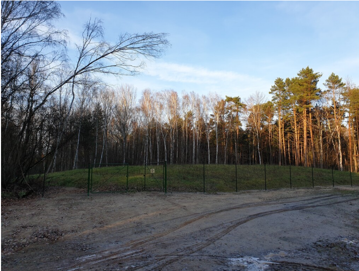
ehem. Teersee bei Wolfshain