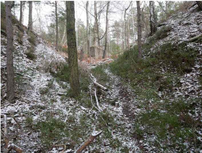
Fragmente aufstrebenden Mauerwerks (verm. Seilbahnrelikte der Grube Felix bei Bohsdorf bzw. Conrad)