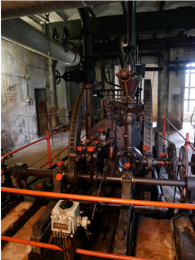
Brikettpresse Nr. 1