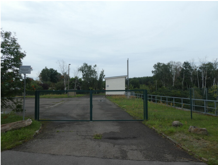
Speicher Koschen Einlaufbauwerk