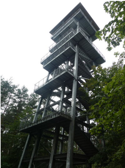
Schiefer Turm am Senftenberger See