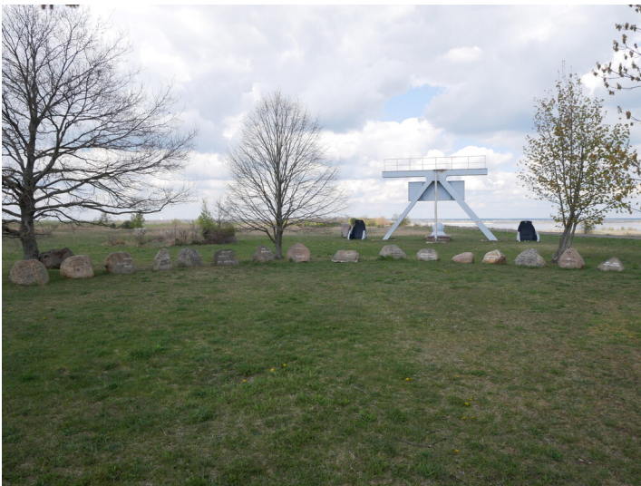
Erinnerungsstätte Reppist, Rauno, Sedlitz (Anna Mathilde), Großräschen (Bückgen), Freienhufen (Birkehain) und Sauo