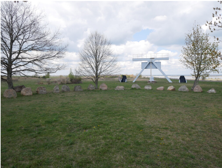
Erinnerungsstätte Reppist, Rauno, Sedlitz (Anna Mathilde), Großräschen (Bückgen), Freienhufen (Birkenhain) und Sauo