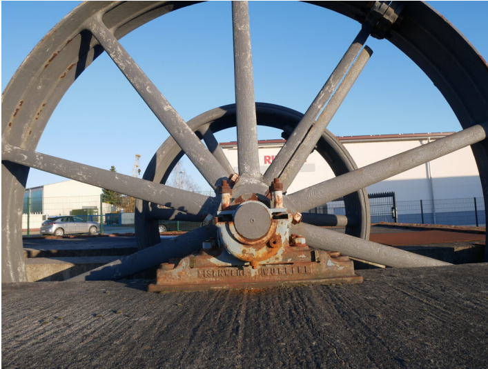
Dampfmaschine aus einer örtlichen Tuchfabrik.