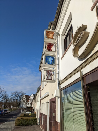
Elfes Textilwaren